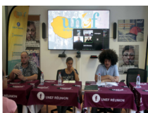
« L'UNEF fait rejeter l'augmentation des tarifs au CROUS de La Réunion » 171 votes : le développement du CROUS pour contre l'augmentation des tarifs des logements universitaires.